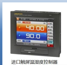
进口触摸屏温湿度控制器